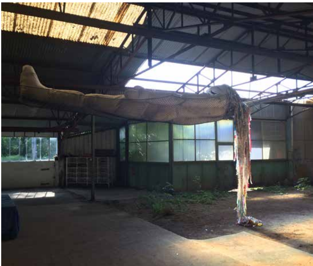
Miranda (2010) de Julia Boix-Vives en situation de stockage visible au dépôt cONcErn.