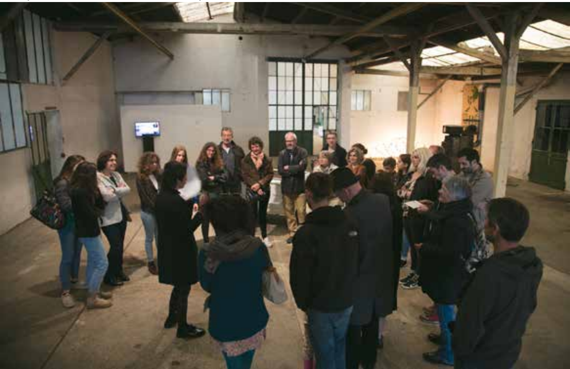
Réception des œuvres de Amandine Capion et de Salomé Aurat en mai 2018.