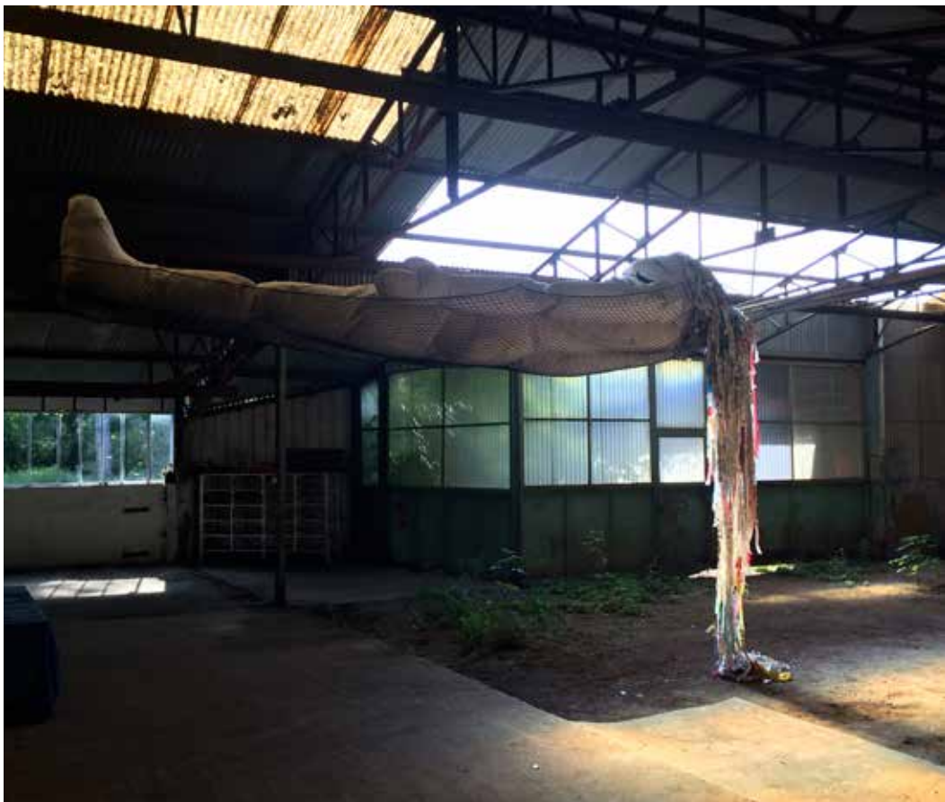
Miranda (2010) de Julia Boix-Vives en situation de stockage visible au dépôt cONcErn.