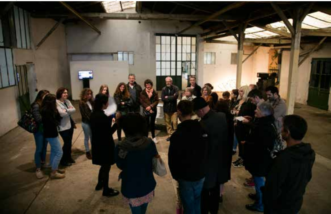
Réception des œuvres de Amandine Capion et de Salomé Aurat en mai 2018.